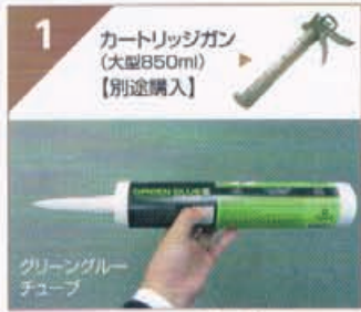
1 カートリッジガン (大型850ml) 【別途購入】