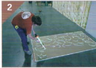
2 ボードの表面にグリーングルーを 塗布します。