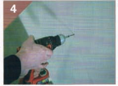
4 ネジ留めします。 グリーングルーは均一な薄い膜 (厚み0.5mm)を形成します。