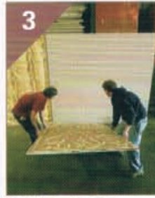
3 既存のボードに 貼り付けます